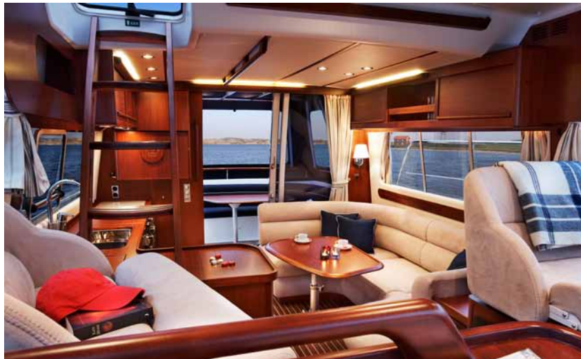
ELEGANT AND TIMELESS INTERIOR DESIGN ELEGANTE UND ZEITLOSE INNENAUSSTATTUNG