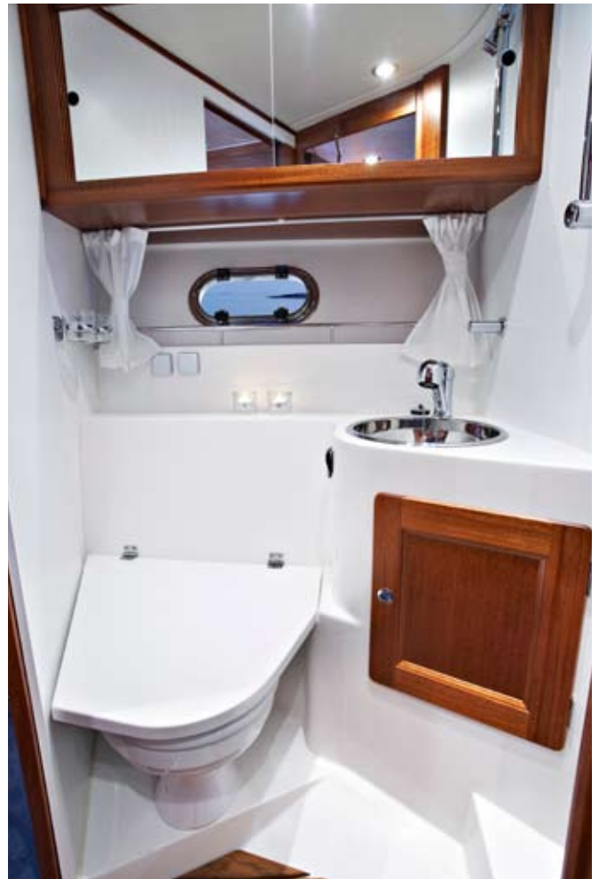
Backbord WC mit integrierter Dusche in 3-Kabinenversion