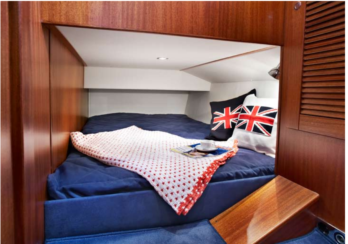
Extra Gästekabine in 3-Kabinenversion