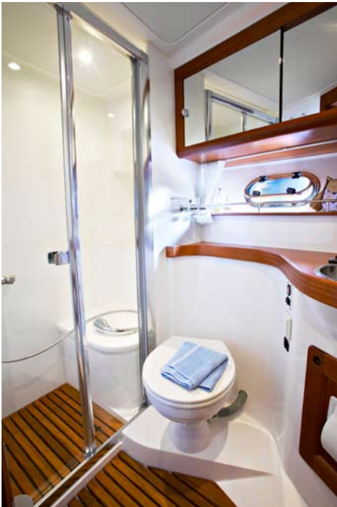
Backbord WC mit separate Dusche für Eigenerkabinen in 2-Kabinenversion